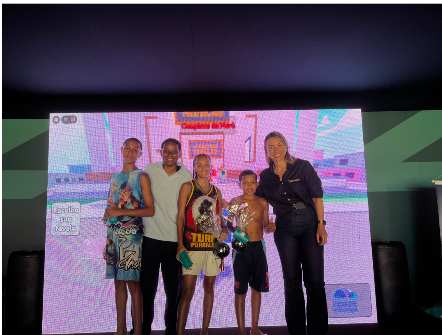
VENCEDORES DO DESAFIO