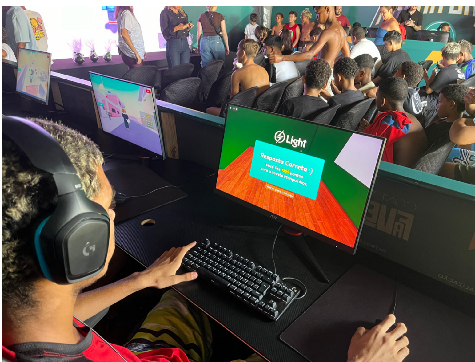
ATIVAÇÃO DO GAME NA ARENA GAMER DO CONEXÃO FAVELA