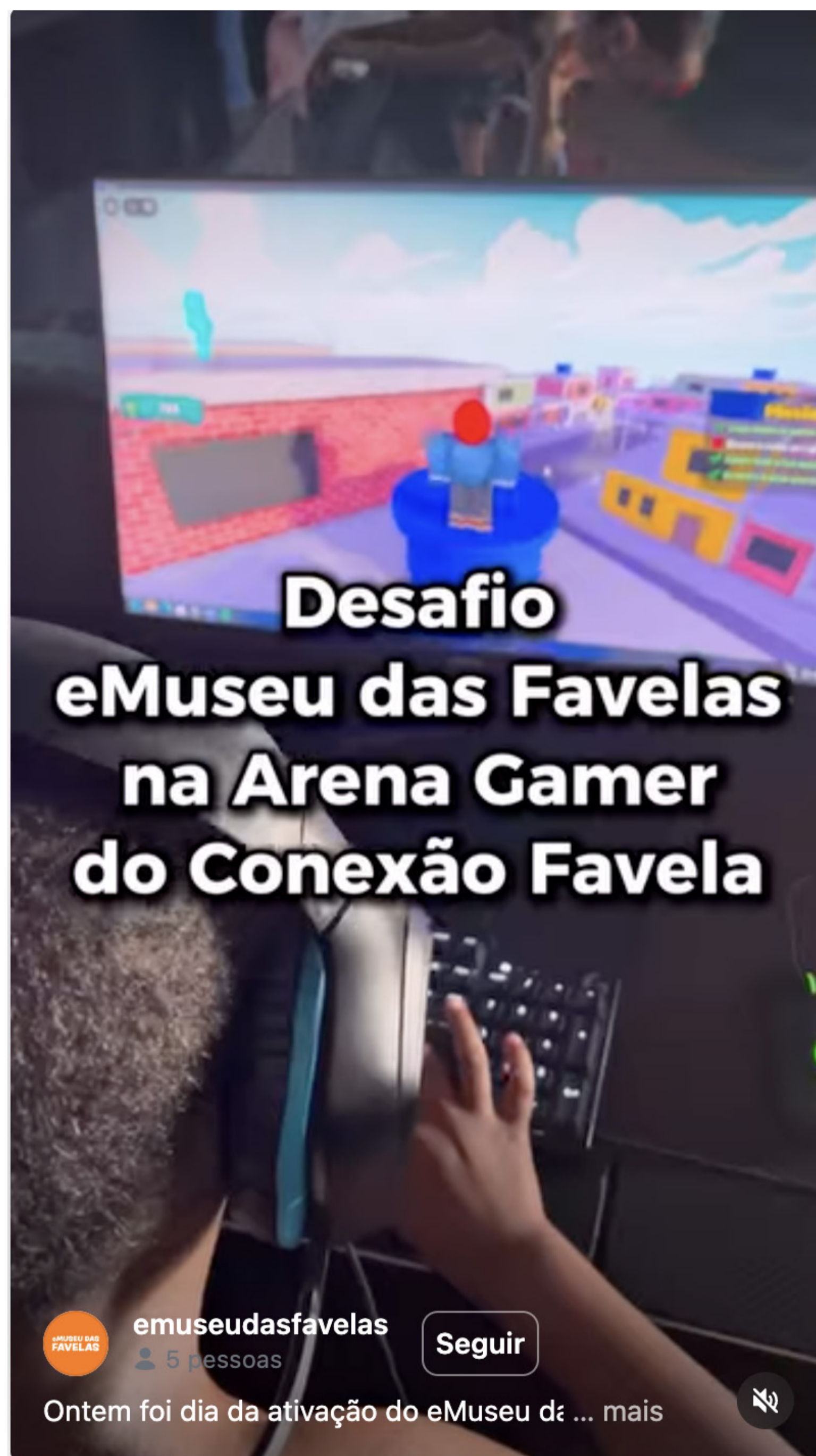
TOQUE PARA VER O VÍDEO